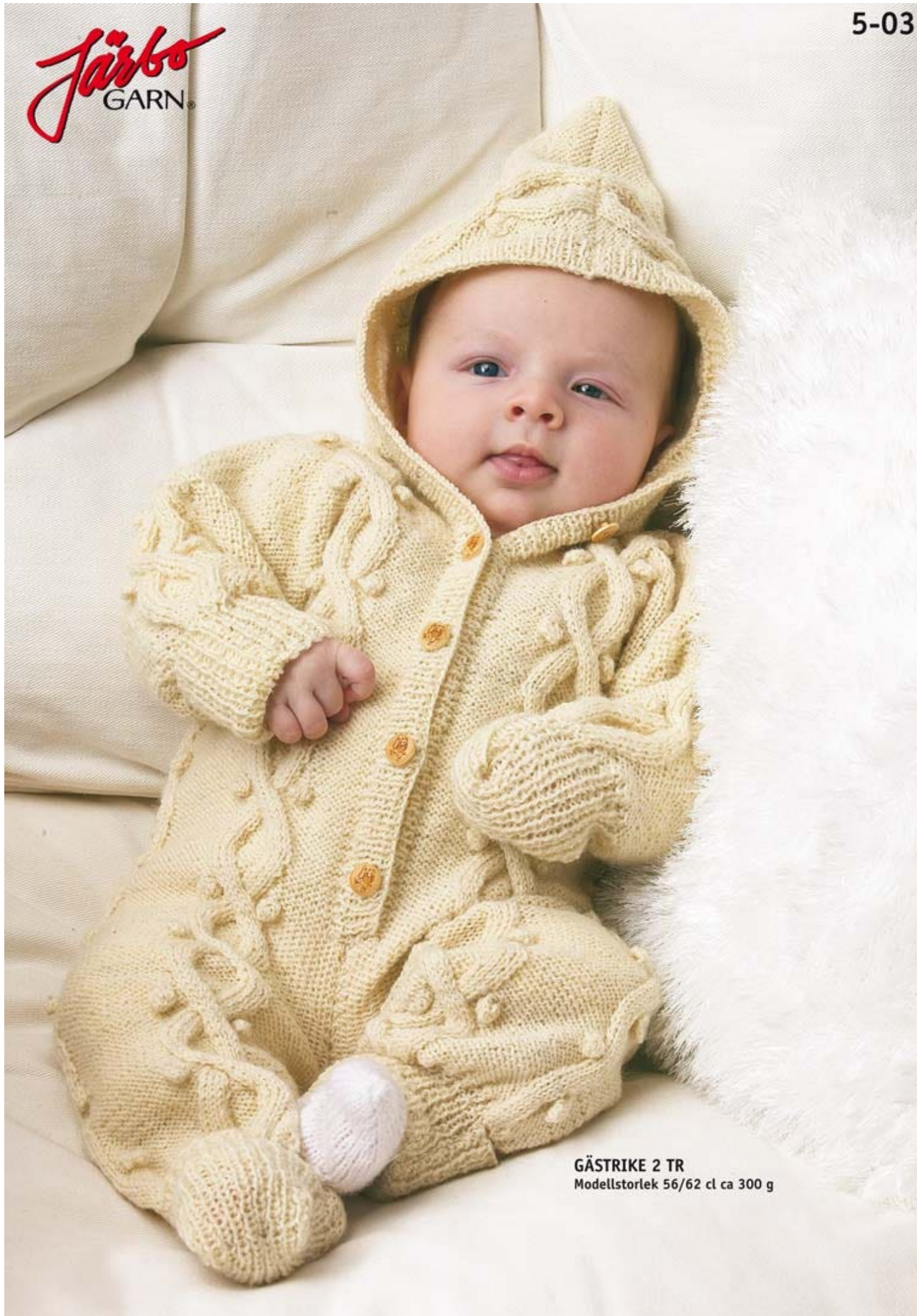
GÄSTRIKE 2 TR Modellstorlek 56/62 cl ca 300 g