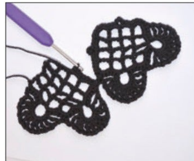
2:a hjärtat: Hopvirkning på varv 6